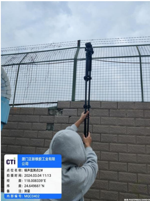
噪声监测点 2# (昼间)