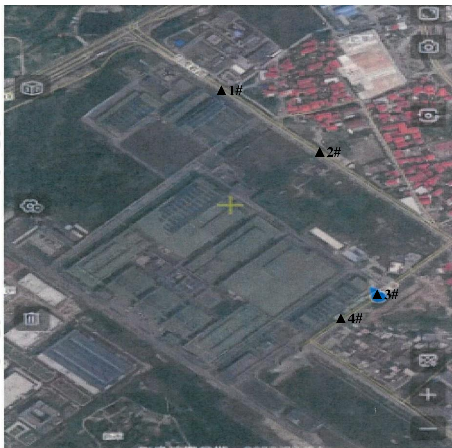
附：厂界噪声现场测点示意图