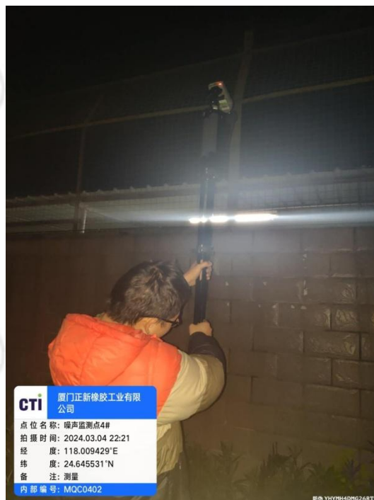
噪声监测点 4# (夜间)