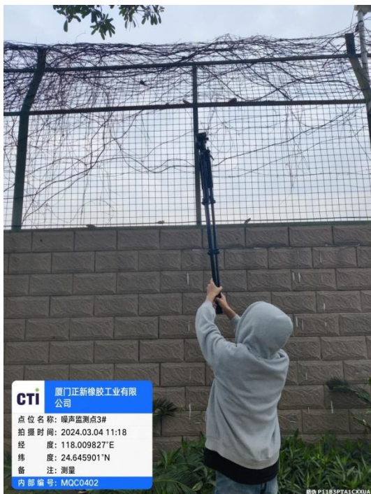
噪声监测点 3# (昼间)