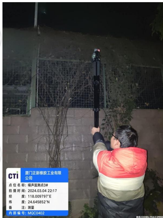
噪声监测点 3# (夜间)