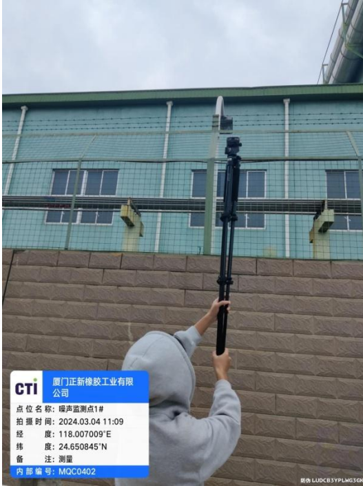
噪声监测点 1# (昼间)