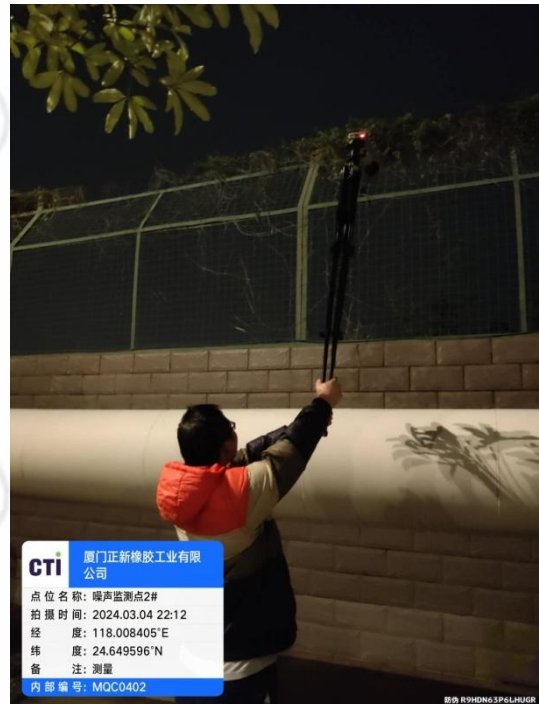
噪声监测点 2# (夜间)