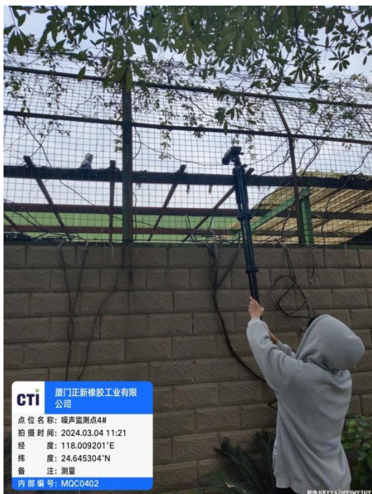
噪声监测点 4# (昼间)